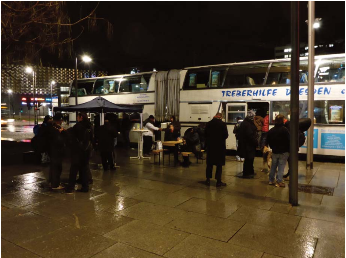
Mobile Jugendarbeit - Das Busprojekt JUMBO der Treberhilfe Dresden e.V.

So ziehen sich oft Politik und Verantwortliche auf die "Vogel-Strauß-Methode" zurück. Entweder man tut so, als ob es die Problematik nicht wirklich gäbe, sie überraschend aufträte oder man reagiert eben mit Verboten. So ist in vielen Städten und seit Langem bspw. das Betteln mit Hunden oder aggressives Betteln verboten. Ein Bettelverbot von/mit Kindern wird aktuell in Dresden diskutiert und in Städten wie Leipzig, Essen und Berlin bereits in der lokalen Polizeiverordnung verboten (vgl. Sächsische Zeitung: Bettelkinder werden als Werkzeuge missbraucht. - 20.04.17 - http://www.sz-