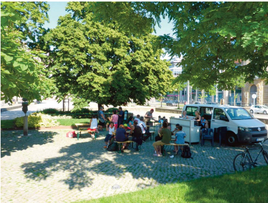
kleiner Spielbus der Treberhilfe Dresden e.V.

Was tun nun Wohnungslose, deren einziger Gefährte ihr Hund ist? Wo bringen sie diesen hin, wenn sie „auf Arbeit“ gehen? Was tun Familien aus Osteuropa, die auf eine „gebende Hand“ hoffen und auf diese angewiesen sind? Können sie ihre Kinder so einfach in Kindergärten, Tageseinrichtung oder in Schulen bringen? Vor allem wenn sie fahrend und nicht ortsansässig sind und/oder sein wollen bzw. auf Gelegenheitsjobs angewiesen sind? Würde wir ihnen genauso viel, wie den Kindern oder einem Menschen ohne Hund gegeben? Ist Straßenmusik erlaubt, gewollt und hellt das bunte Stadtleben auf oder wird es geduldet und erscheint den Ladenbesitzern als hinderlich?