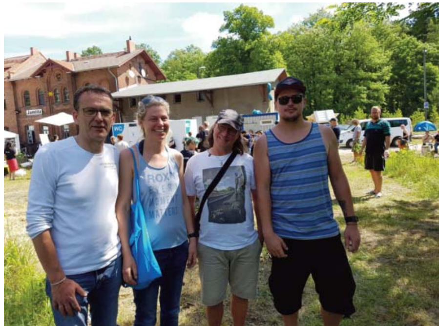
Vorstand Bündnis für Straßenkinder