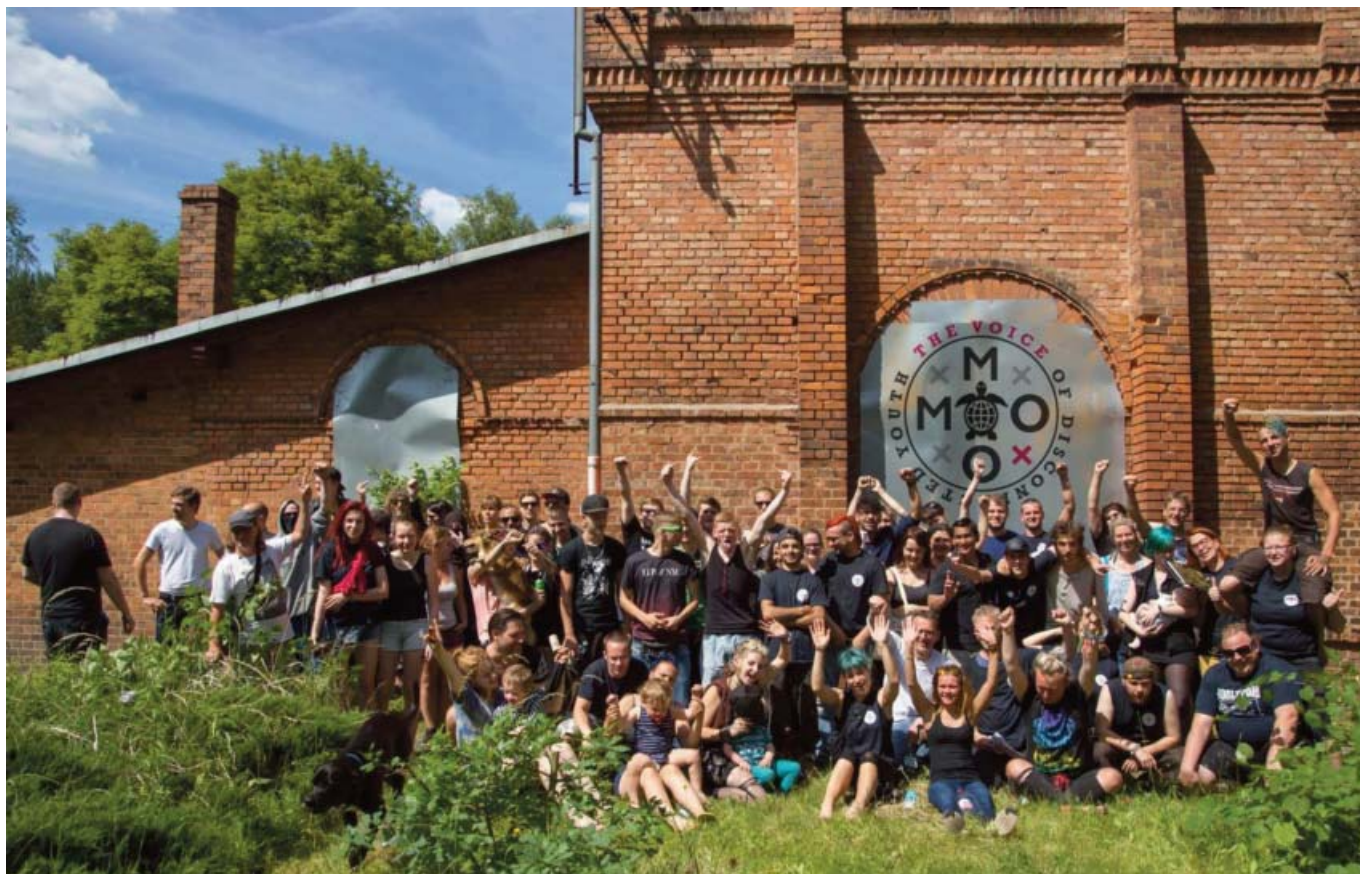
Das 3. Treffen: Bundeskonferenz der Straßenkinder Jamlitz 9.-11.6.2017

Derzeit leben 37.000 Jugendliche und junge Erwachsene bis 27 Jahre in Deutschland ohne festen Wohnsitz. Wir nennen sie „Straßenkinder“. Punks, die an Ecken stehen und schnorren, wohnungslos sind oder bei Freunden schlafen, sind auch in Dresden jedem Neustädter bekannt und gehören auch in der Altstadt zur Straßenszene.